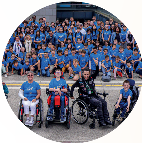
Zinédine Zidane Parrain d'ELA

L'Association Européenne contre les Leucodystrophies (ELA) décerne à ..... ce diplôme pour son engagement solidaire à travers la Dictée d'ELA organisée au profit de la lutte contre les leucodystrophies.