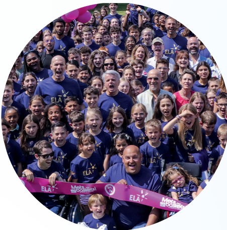
Zinédine Zidane Parrain d'ELA

L'Association Européenne contre les Leucodystrophies (ELA) décerne à ..... ce diplôme pour son engagement solidaire à travers l'opération "Mets tes baskets et bats la maladie" au profit de la lutte contre les leucodystrophies.