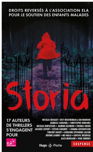
1 € par livre Storia reversé à ELA