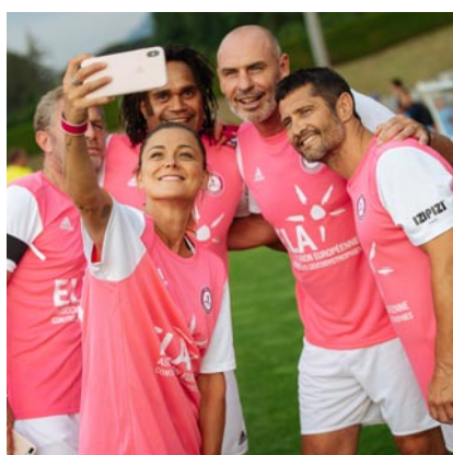
The Evian Championship