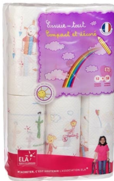
3 % du CA HT reversés annuellement par SOFIDEL sur les ventes d'une gamme de papier toilette et essuie-tout