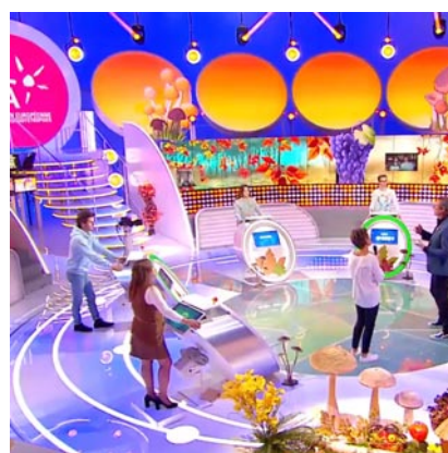
Émission "Les 12 coups de midi"